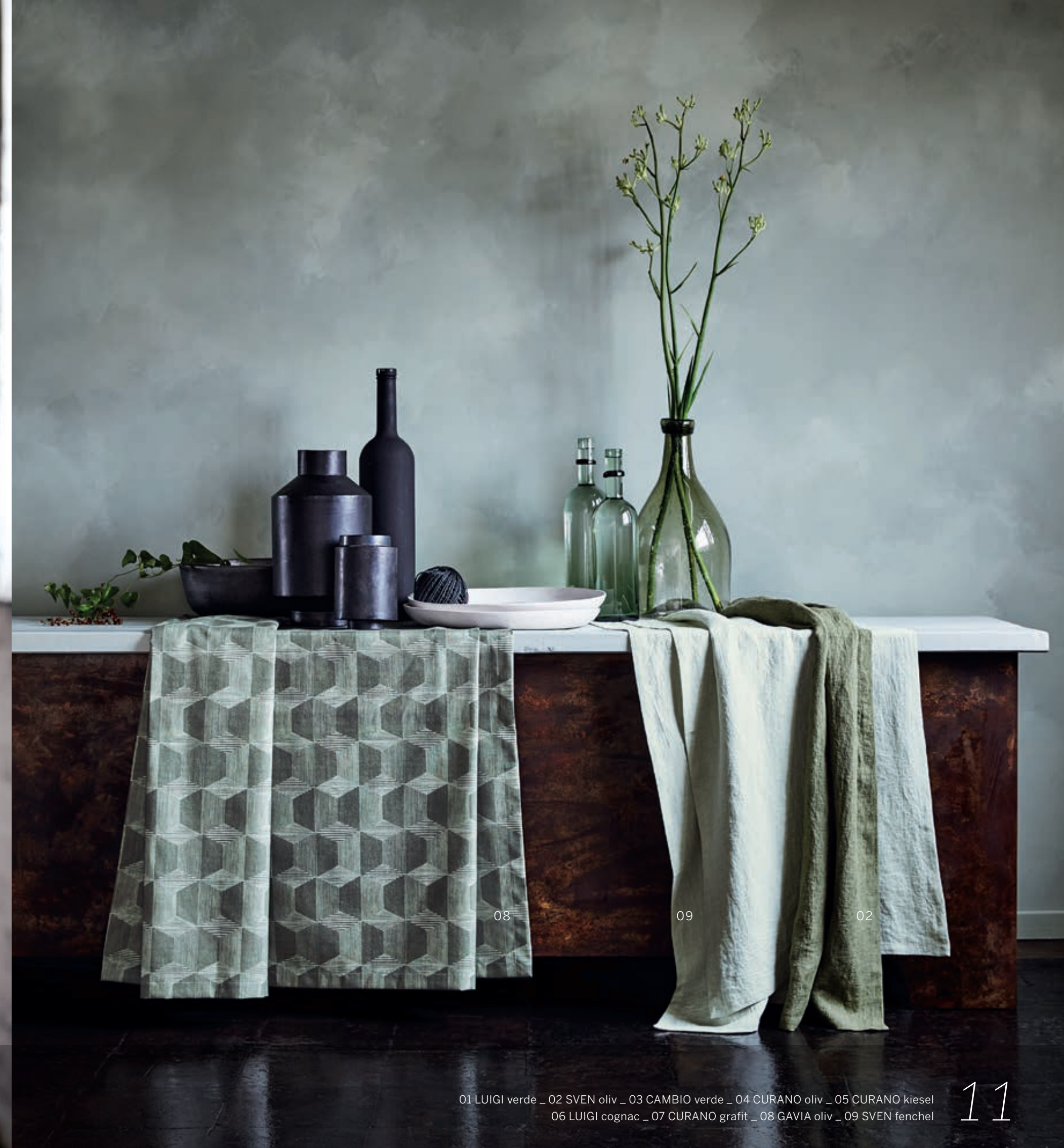
01 LUIGI verde _ 02 SVEN oliv _ 03 CAMBIO verde _ 04 CURANO oliv _ 05 CURANO kiesel 06 LUIGI cognac _ 07 CURANO grafit _ 08 GAVIA oliv _ 09 SVEN fenchel